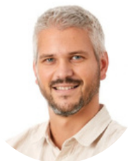
Quentin Gautherot Informatique