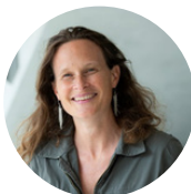
Ségolène de Retz Fondation A.R.C.A.D